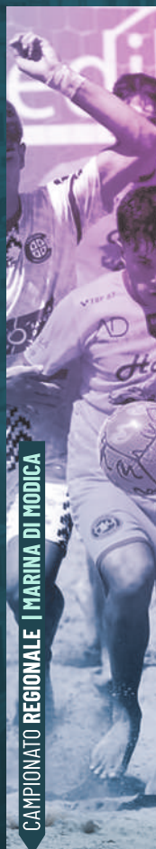
CAMPIONATO REGIONALE | MARINA DI MODICA