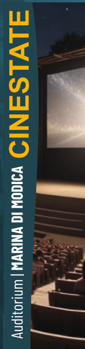
Auditorium | MARINA DI MODICA